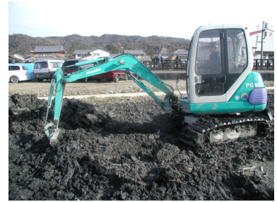
パワーショベル(レンボリー)