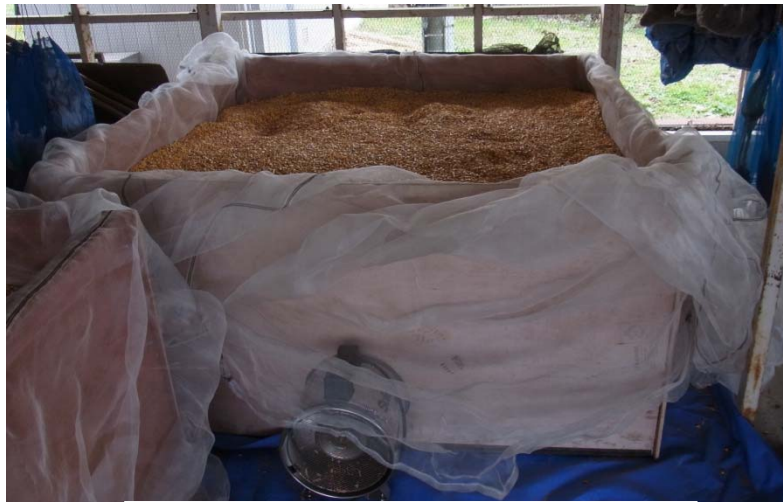
図7 平型乾燥機による子実の乾燥試験