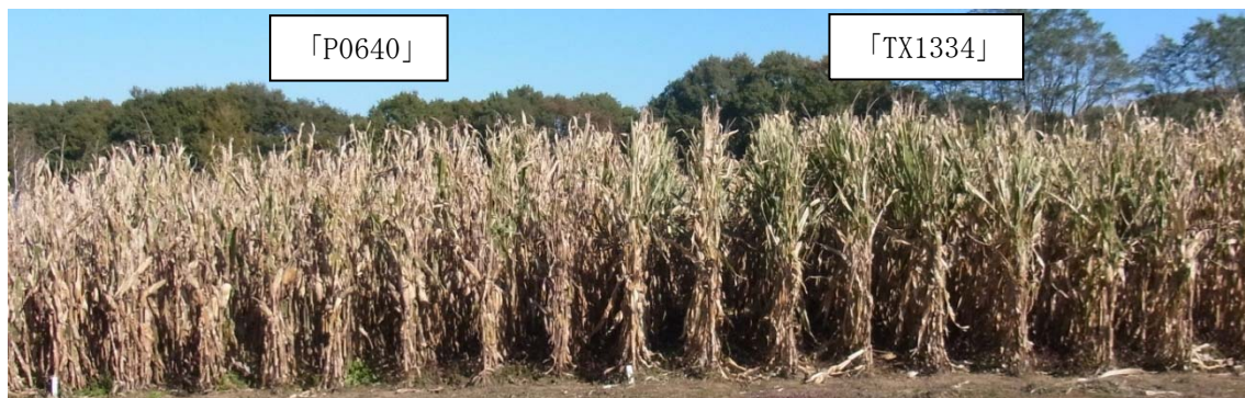
図4 子実と茎葉の水分を低下させるための立毛乾燥(11月4日)