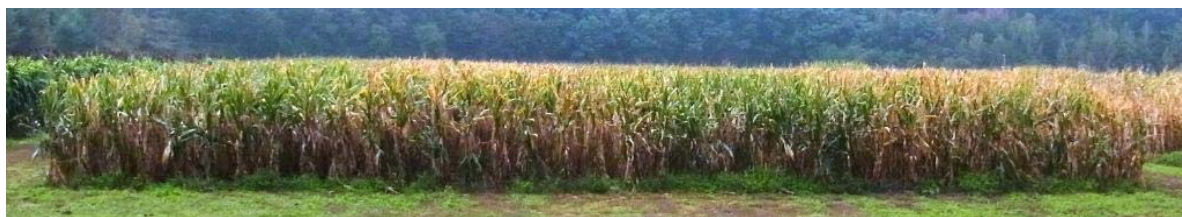
図3 圃場全景（10月18日、子実はほぼ成熟期だが、上位葉はまだ緑度を保っている。）