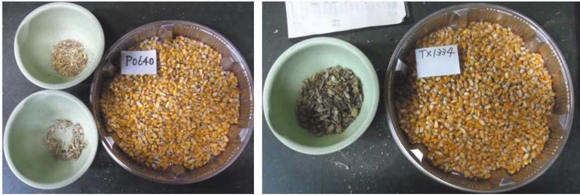
図6 収穫物の夾雑物の状況（茎の水分が高いと夾雑物が多くなる傾向。）