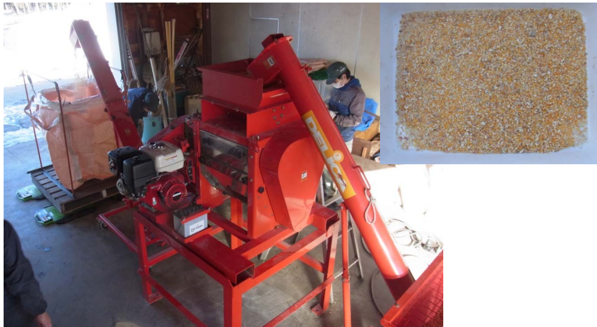
図8 トウモロコシ子実の破碎試験