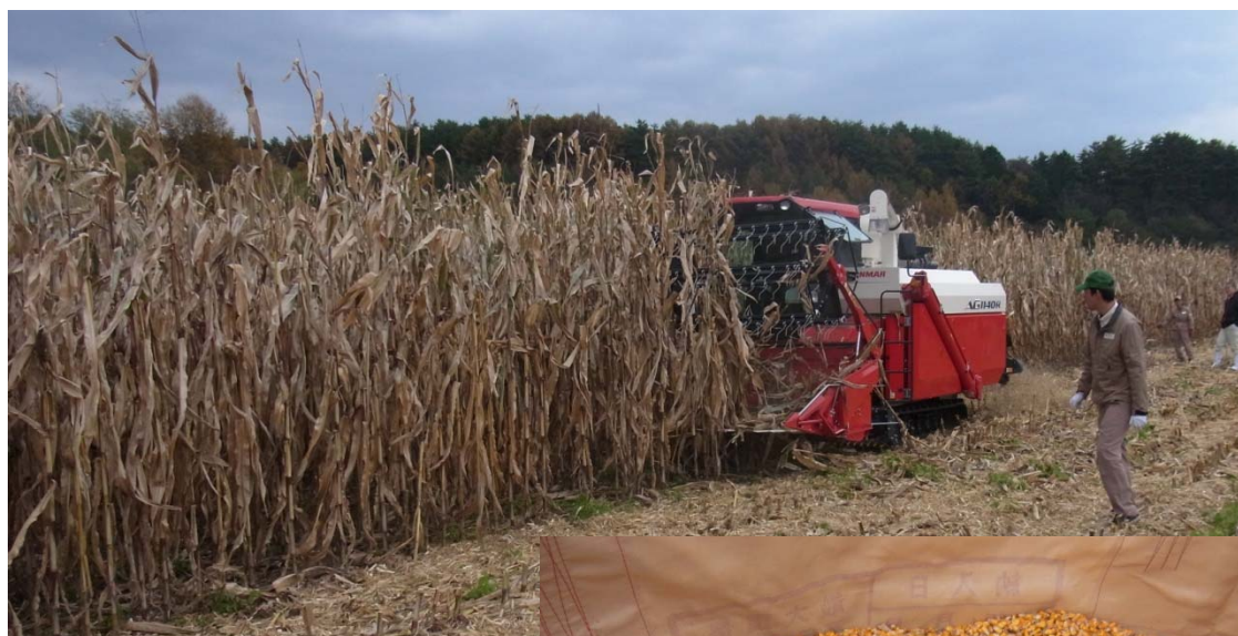
図5 汎用コンバイン AG1140R による子実収穫（11月8日） （品種：「TX1334」）