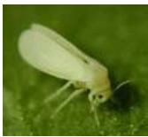
メロン退緑黄化病 (左)、トマト黄化葉巻病 (右) の発病株とウイルスを媒介するタバココナジラミ (下)