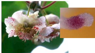
キウイフルーツの溶液受粉後の花(左) と柱頭の様子(右)