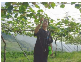
キウイフルーツ溶液受粉の様子

現在、産地ではキウイフルーツかいよう病菌Psa3系統による被害が深刻であるが、本溶液受粉法は花粉の殺菌にも活用が可能であり、新優良台木苗はその発生園地の再生にも用いられるなど、波及効果も高い。