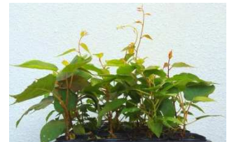
シマサルナシの実生苗